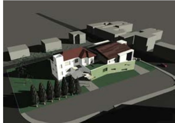
I progetti delle scuole di Bagno (in alto) e Cadè

euro il costo del progetto. Centri educativi pomeridiani (Cep): 3 interventi; 54 ragazzi iscritti; 381.500 euro il costo del progetto. Ludoteche : 6 esperienze; circa 26.000 presenze annue; 160.130 euro in costo del progetto. Consigli dei ragazzi : due esperienze; 56 ragazzi eletti e partecipanti; circa 400 ragazzi coinvolti nei progetti; 42.000 euro di spesa. Progetto Polo : una esperienza; 125 ragazzi coinvolti; 55.500 euro di finanziamento erogato. Soggiorni estivi : 5 soggiorni (10 turni complessivi); 361 ragazzi; 29.800 euro di spesa. Campi gioco estivi : 15 campi gioco convenzionati; 1.194 bambini coinvolti; 41.412 euro di spesa. Progetto Autonomia (inserimento bambini disabili nelle attività estive): campi gioco e soggiorni estivi, 64 ragazzi coinvolti; 177.700 euro di spesa.