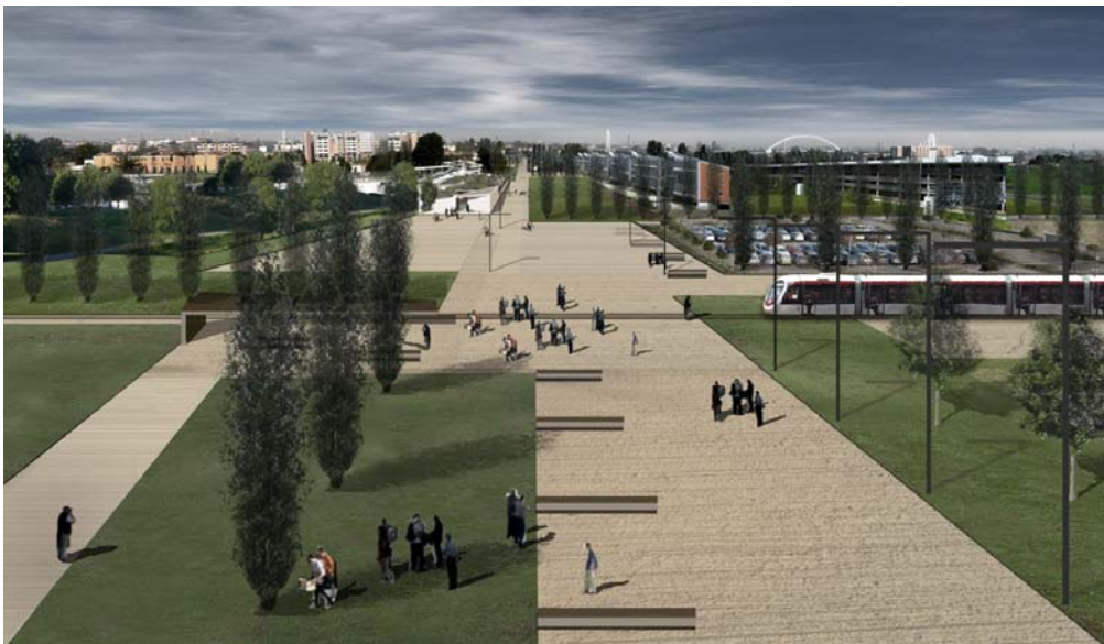
Spazi pubblici area nord con tramvia