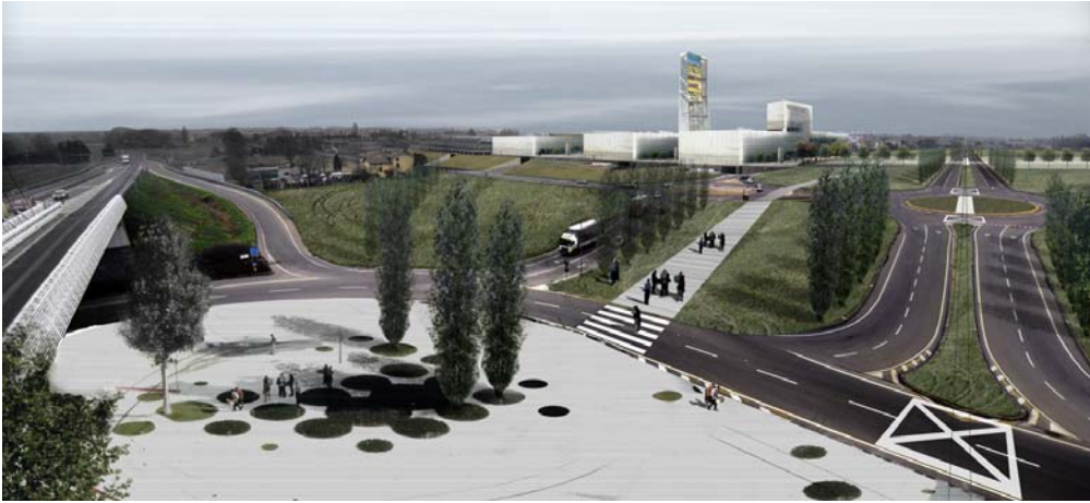
Expo (ex Fiere)