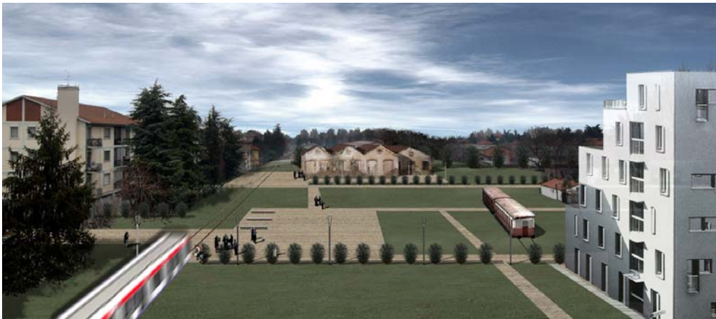
Quartiere con tramvia